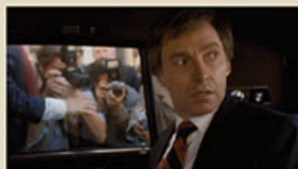
The Front Runner

considération pour elle et son avenir. Il n'oublie pas de s'attarder sur les piètres conditions sociales des habitants des campagnes roumaines. « Une mise en scène fluide, un casting tant français que roumain de choix et une analyse jamais manichéenne de la manipulation de l'homme par l'homme font de ce film à la fois simple et raffiné un moment intense de cinéma. » Avoir-alire